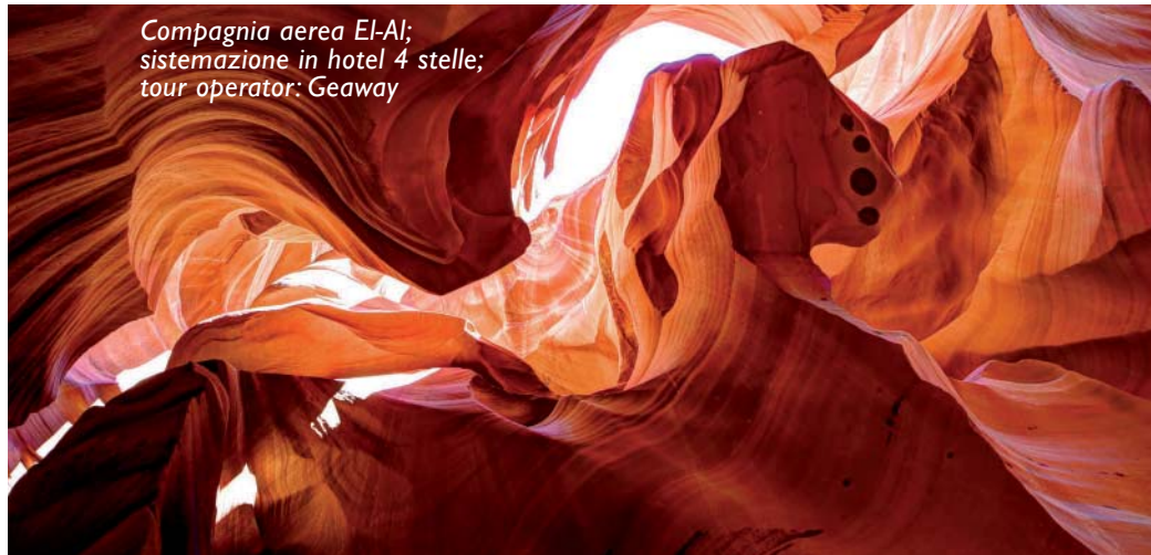
Compagnia aerea El-Al; sistemazione in hotel 4 stelle; tour operator: Geaway